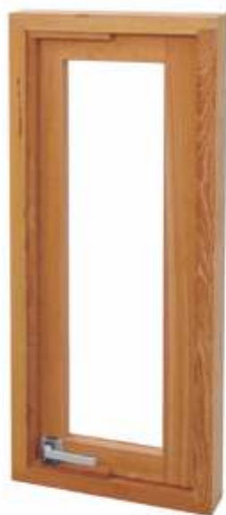
JP 400 . JANELA PIVOTANTE