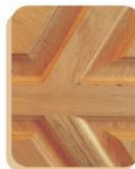
PAD . PORTA ALMOFADAS DIAGONAL