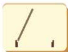
abertura para a esquerda