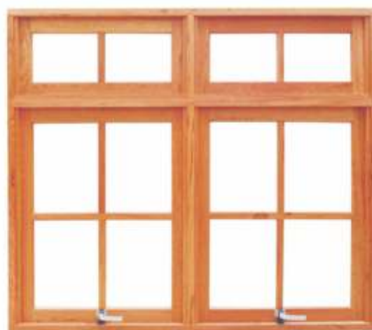
ME 902 B . JANELA MAXIMAR DUPLA COM BANDEIRA