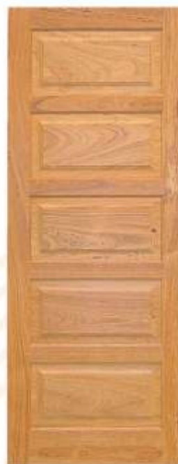
PA 05 . PORTA 05 ALMOFADAS