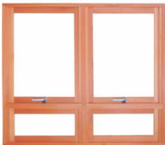
ME 900 P . JANELA MAXIMAR DUPLA COM PEITORIL