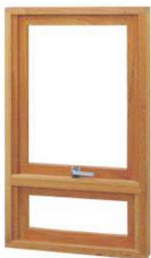
M 700 . JANELA MAXIMAR C/ PEITORIL