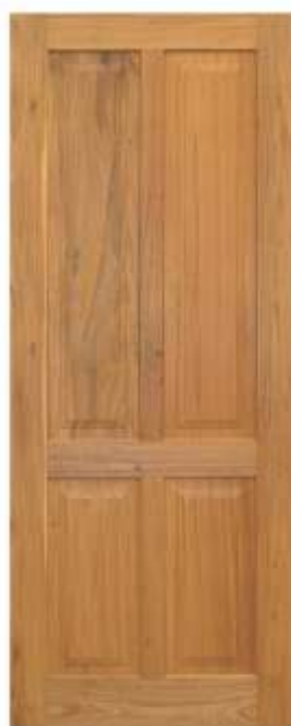
PA 04 . PORTA 04 ALMOFADAS