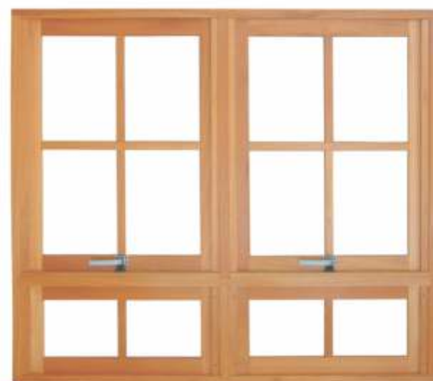
M 902P . JANELA MAXIMAR DUPLA C/ PEITORIL