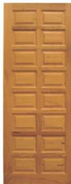
PA 16 . PORTA 16 ALMOFADAS