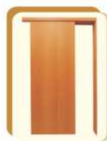
Abertura para o lado direito