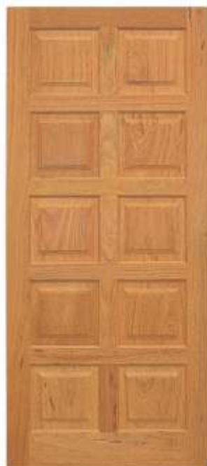
PA 10 . PORTA 10 ALMOFADAS