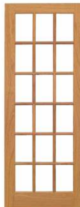
PV 15 . PORTA VIDRO QUADRICULADO