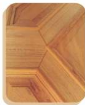
PAM 01 . PORTA ALMOFADAS DUPLAS COM MOLDURAS