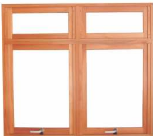
ME 900 B . JANELA MAXIMAR DUPLA COM BANDEIRA