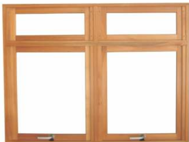
M 900B . JANELA MAXIMAR DUPLA C/ BANDEIRA