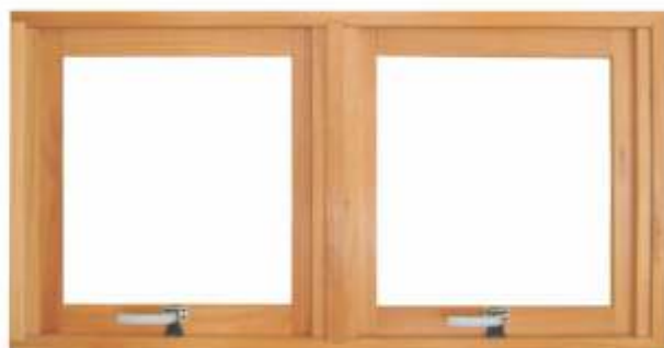
M 600 . JANELA MAXIMAR DUPLA