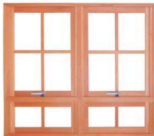
ME 902 P . JANELA MAXIMAR DUPLA COM PEITORIL