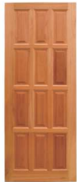
PAE 12 . PORTA 12 ALMOFADAS