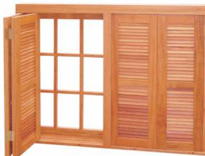
EV 112 . JANELA VENEZIANA PANTOGRÁFICA