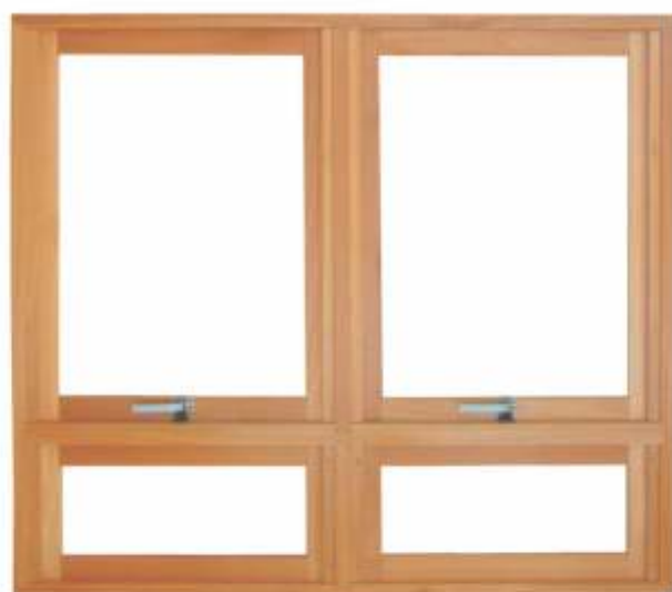
M 900P . JANELA MAXIMAR DUPLA C/ PEITORIL