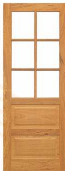
PAV 06 . PORTA ALMOFADA E VIDRO