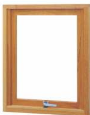
M 300 JANELA MAXIMAR SIMPLES