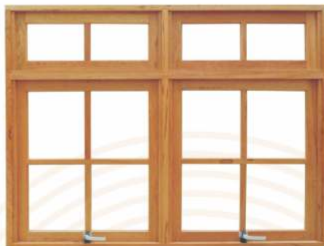
M 902B . JANELA MAXIMAR DUPLA C/ BANDEIRA