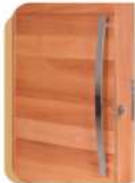
PPVE 100 . PORTA PIVOTANTE COMPLETA