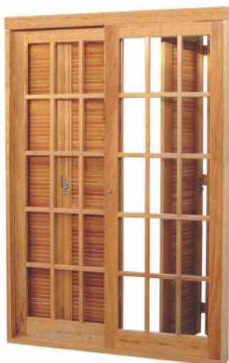
PV 212 . PORTA DE CORRER C/ VENEZ. PANTOGR.