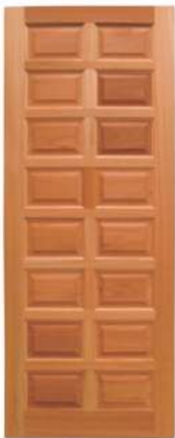
PAE 16 . PORTA 16 ALMOFADAS