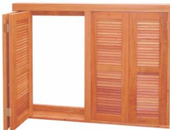
EV 110 . JANELA VENEZIANA PANTOGRÁFICA