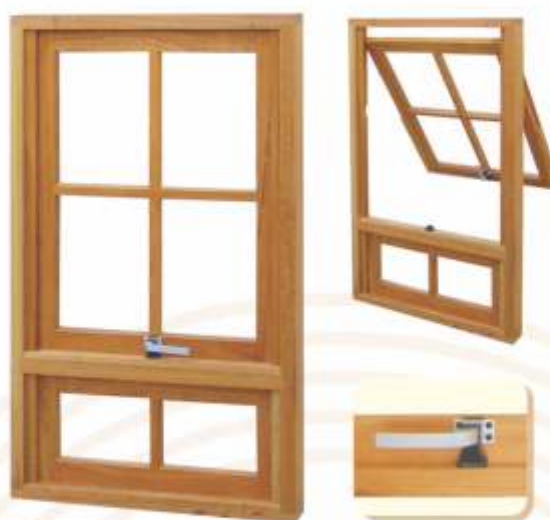
M 702 . JANELA MAXIMAR C/ PEITORIL