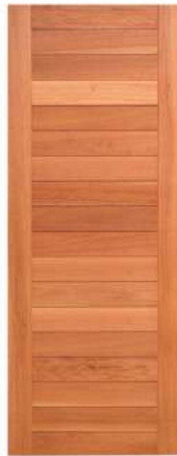
PAN 18E . PORTA 18 ALMOFADAS COM NEGATIVOS