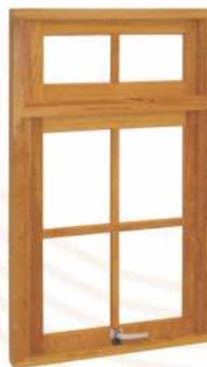
M 802 . JANELA MAXIMAR C/ BANDEIRA