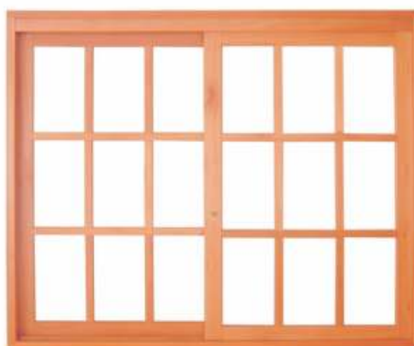
EC 122 . JANELA DE CORRER