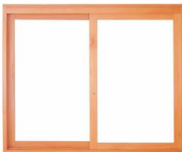
EC 120 . JANELA DE CORRER