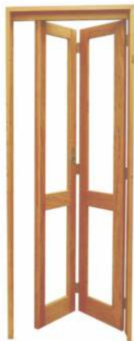
PPI 270 . PORTA INTERNA VIDRO PANTOGR.