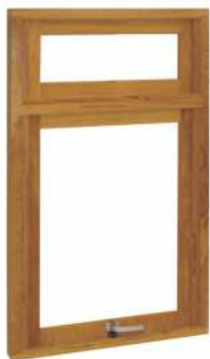
M 800 . JANELA MAXIMAR C/ BANDEIRA