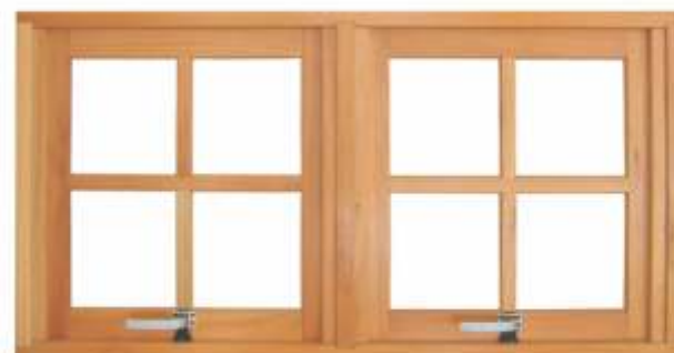
M 602 . JANELA MAXIMAR DUPLA