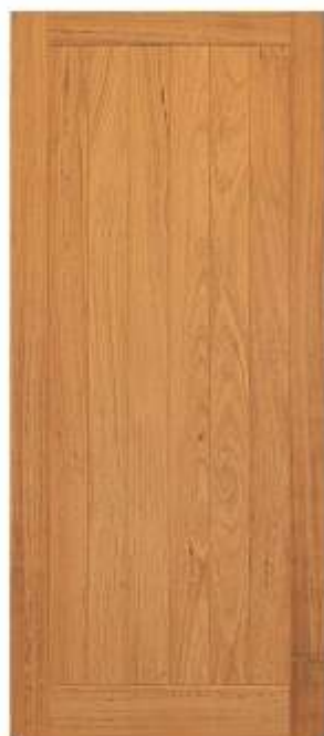
PL 35 . PORTA LAMBRI MACIÇA