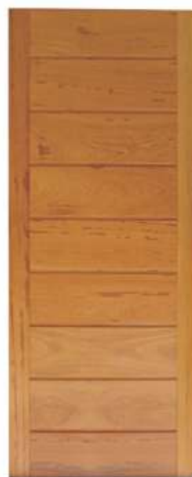
PPV 100 . PORTA PIVOTANTE COMPLETA