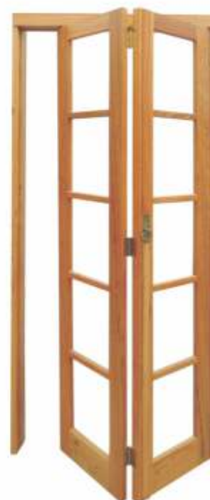
PPI 272 . PORTA INTERNA VIDRO PANTOGR.