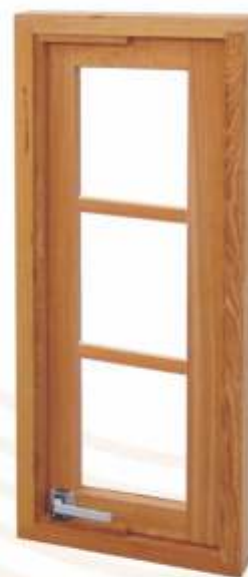
JP 402 . JANELA PIVOTANTE