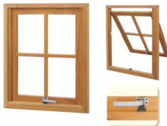
M 302 . JANELA MAXIMAR SIMPLES