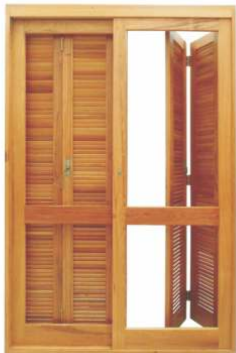
PV 210 . PORTA DE CORRER C/ VENEZ. PANTOGR.