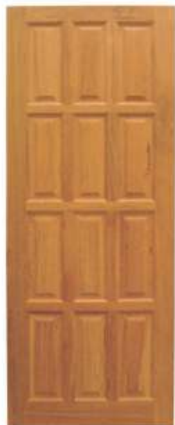
PA 12 . PORTA 12 ALMOFADAS