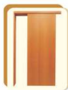
Abertura para o lado esquerdo